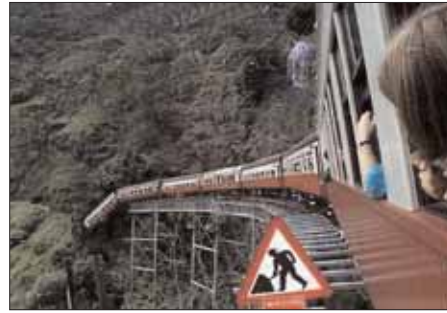
Abb. 3. OHSAS 18001 – damit sich solche Sachen nicht mehr ereignen.

Das Management der Arbeitssicherheit ist durch ein OHSAS viel näher an die «normalen» Führungsprozesse angekoppelt, und ein Stillstand des Sicherheitssystems ist somit nicht möglich. Die – auch in wirtschaftlicher Hinsicht relevante – Sicherheit und die Gesundheit der Mitarbeitenden wird kontinuierlich, nachhaltig und sinnvoll verbessert.